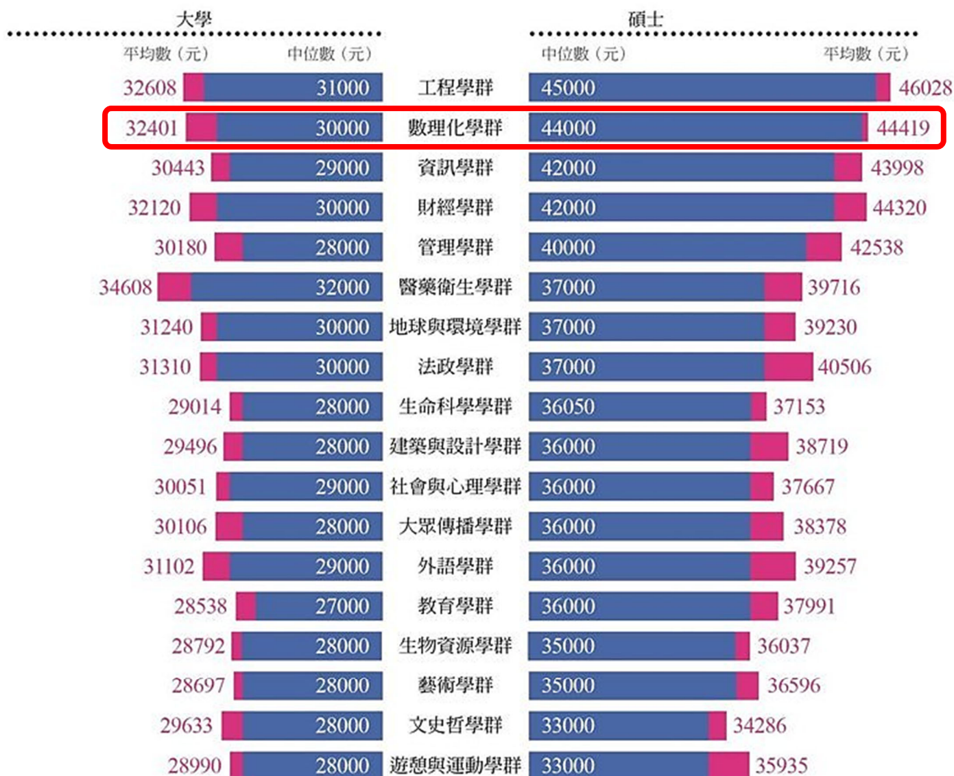
表4「薪」情大不同！18學群大學、碩士畢業生起薪大公開

註：①十年內更新且畢業（或役畢）後第一份正職工作的月薪。②中位數代表整體薪資數據的1/2位置，此數字之上與之下各占一半人數，可看出多數人薪資的落點位置。平均數會因少數極端值而被拉高或拖低，平均數高於中位數愈多，代表該領域較有機會拿到高薪。 資料來源：104資訊科技